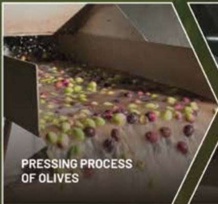
PRESSING PROCESS OF OLIVES