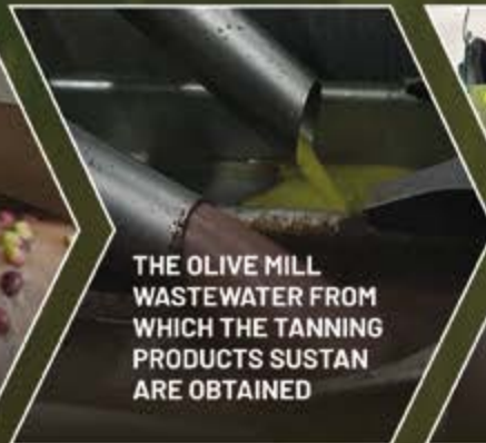
THE OLIVE MILL WASTEWATER FROM WHICH THE TANNING PRODUCTS SUSTAN ARE OBTAINED